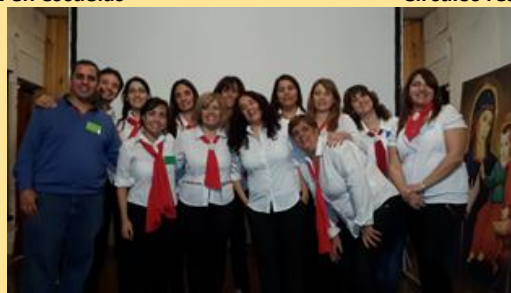
Parte del equipo nodo Mendoza, después de una “degustación ESPERE” simultánea con 80 personas.