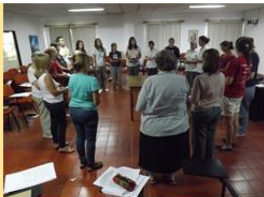
Primer encuentro de capacitación nodo Córdoba (Jesús María)