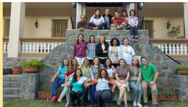
Taller que se ofreció en la comunidad de Río Ceballos