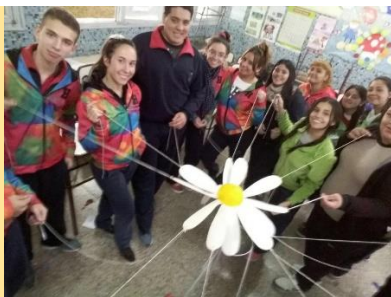
ESPERE en escuelas

El nodo Mendoza no sólo trabaja ESPERE, sino que se especializa en REACH model –Perdón en parejas- (Worthington), Círculos de Paz (Bochkova), Justicia Restaurativa (Centro de educación popular y DDHH de San Pablo) y Dispositivos de Significación Social Emocional (Intergentes). Para ello, con el apoyo de los Misioneros de la Consolata, se ha tenido la posibilidad de entrenarnos en estas técnicas en varios países. También se ha facilitado la venida a Mendoza de estos investigadores. Nuestras investigaciones y prácticas han logrado el aval académico de la Universidad Nacional de Cuyo y de la Universidad Tecnológica Nacional.